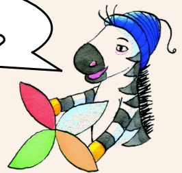
Abbildung: Anja Vogel-Jaich, Berlin

Die ganze Schule ist eine Turnhalle. Überall stehen Turngeräte und Spielsachen. Die Kinder dürfen den ganzen Tag klettern, rennen und spielen. Es gibt keine Hefte und Bücher.